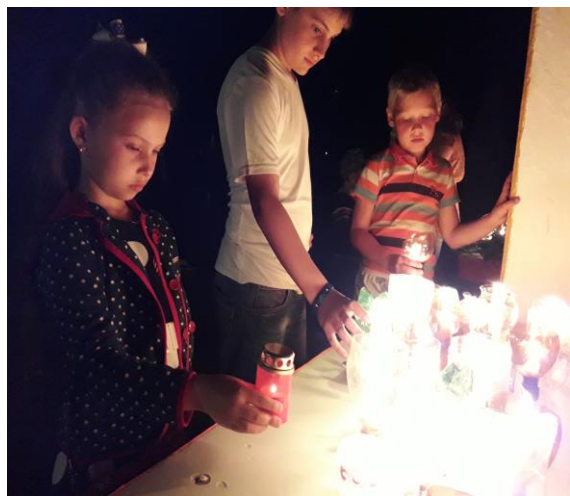
Всероссийская акция «Свеча памяти»

Выходит с 01.12. 2012г, выпускается МБУ «Библиотека МО Школьненское сельское поселение Белореченского района» Новоалексеевской СБ № 56(106) от 25.05. 2018г.