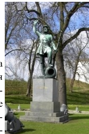
Монумент "Неизвестный пехотинец" в Дании

В России традиция подобных захоронений ведет свою историю с мемориала в память о жертвах Февральской и Октябрьской революций 1917 года и Гражданской войны (1917-1922), который был открыт 7 ноября 1919 года на Марсовом поле в