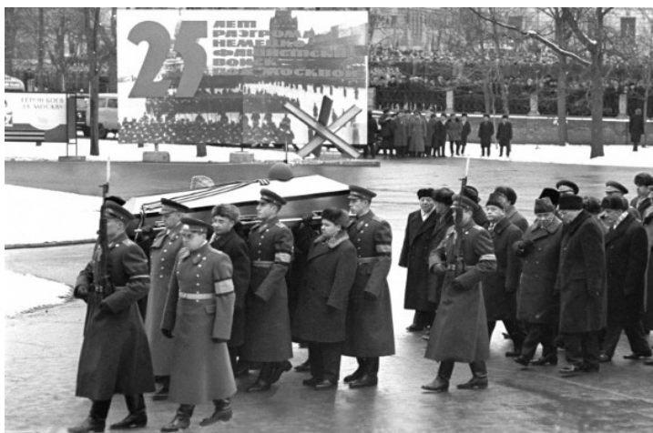
Захоронение праха Неизвестного солдата у Кремлевской стены, 3 декабря 1966 года

День неизвестного солдата — это благодар-