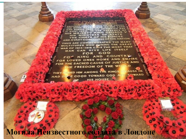
Могилы Неизвестного солдата в Лондоне

В XX веке первые могилы (мемориальные комплексы) Неизвестного солдата появились в 1920 году в Великобритании и Франции, а за ними и в других странах - как членах Антанты, так и их противников. В 1921 году церемонии захоронения Неизвестного солдата прошли в США, Италии, Бельгии и Португалии, в 1922 году - в Чехословакии до конца 1920-х годов подобные мемориалы были сооружены в Болгарии, Австрии, Венгрии, Польше и