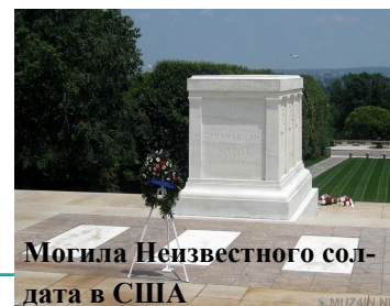
Могилы Неизвестного солдата в США

Однако это могут быть и символические могилы (без захоронений).